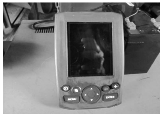
Рис. 3. Мікропроцесорний блок управління ПВГП Fig.3. Microprocessor control unit for DDDS

Значення виміряних глибин залягання ущільненого прошарку ґрунту знімалися з інформаційного табло мікропроцесорного блоку управління (рис. 3).