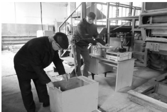
Рис. 1. Лабораторний стэнд для досліджень ПВГП Fig.1. Laboratory bench for the research of the DDDS

Об'єктами досліджень були спеціально створені фізичні моделі ґрунту з різними рівнями залягання ущільненого матеріалу (дерево, ґрунт) в лабораторних (рис. 1) і польових умовах.