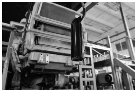
Рис. 2. Установка датчика ПВГП на тракторі Т-150К Fig.2. Installation DDDS sensor on the tractor Т-150К

Методика визначення залежності показів ПВГП від глибини залягання контрольної ущільненої поверхні в умовах одного типу ґрунту передбачала встановлення датчика пристрою (рис. 2) на заданій висоті (0,4 м; 0,3 м; 0,2 м) над спеціальною пересувною платформою, в якій на глибині 0,05 м; 0,25 м; 0,5 м закладені однакові дошки, що засипані однорідним ґрунтом. Переміщаючи платформу в такий спосіб, щоб під датчиком знаходилася дошка на відповідній глибині, фіксують покази ПВГП.