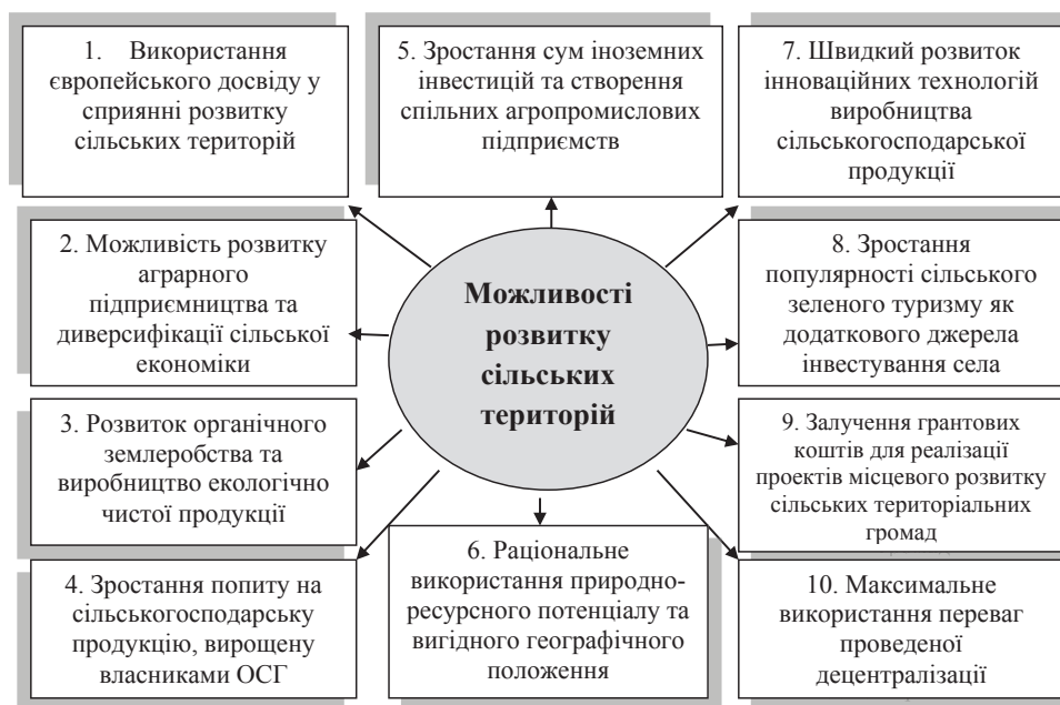
Рис. 3. Потенційні можливості (Opportunities), які сприятливі для розвитку сільських територій Західного Полісся